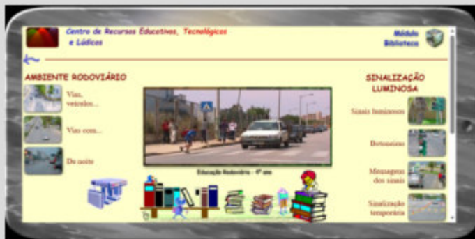
Cidadania Rodoviária - 4º ano EB