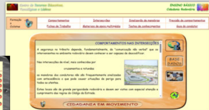
Formação de Ciclistas - 4º ano EB