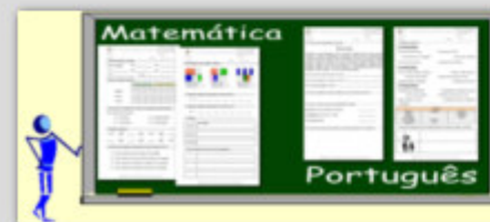
Matemática - Português Fichas de Trabalho